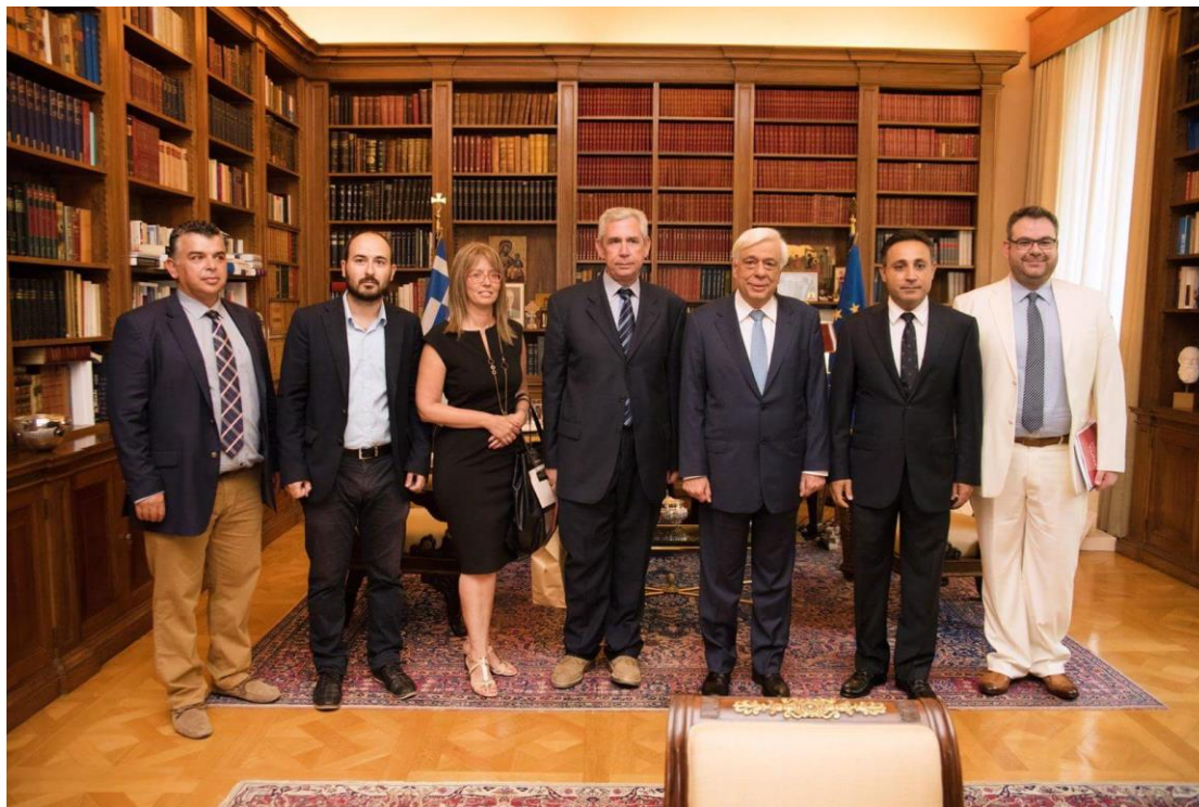
Το Δ.Σ. του Δικτύου Συμπαραστατών με τον Πρόεδρο της Δημοκρατίας

Το Δίκτυο Συμπαραστατών αποτελεί την ένωση των δυνάμεων όλων των αιρετών Δημοτικών και Περιφερειακών Συμπαραστατών.