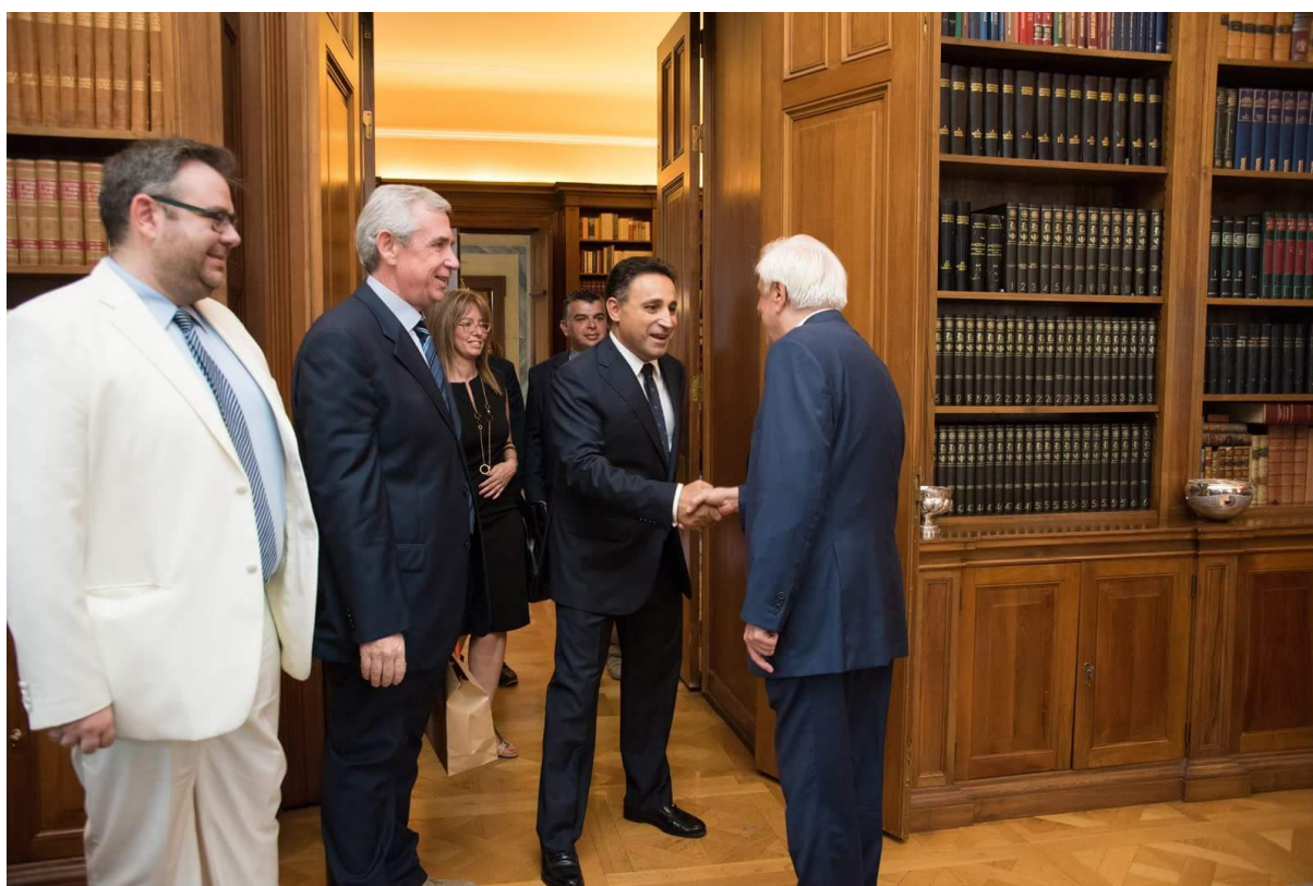
Συνάντηση με τον Πρόεδρο της Δημοκρατίας κ. Προκόπη Παυλόπουλο στο Προεδρικό Μέγαρο.

Συμπαραστάτη Νοτίου Αιγαίου με τον νέο Συνήγορο του Πολίτη κ. Ανδρέα Ποτάκη προκειμένου να υπογραφεί ένα μνημόνιο συνεργασίας ανάμεσα στον Συνήγορο του Πολίτη και το Δίκτυο Δημοτικών και Περιφερειακών Συμπαραστατών έτσι ώστε τοπικές υποθέσεις που αφορούν την Τοπική αυτοδιοίκηση να παραπέμπονται στους τοπικούς διαμεσολαβητές αλλά και σοβαρότερες υποθέσεις να παραπέμπονται στον Συνήγορο του Πολίτη. Η συνάντηση και η υπογραφή του μνημονίου συνεργασίας αναμένεται εντός του 2017 και είναι κάτι που θα δώσει λύση σε αρκετά θεσμικά προβλήματα που αντιμετωπίζουν οι Συμπαραστάτες.