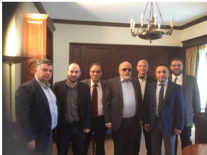
Συνάντηση του Δικτύου με τον Υπουργό Εσωτερικών κ.Κουρουπλή

Τοπικής αυτοδιοίκησης τον κ. Γαιτάνη. Από το κόμμα Ποτάμι η συνάντηση έγινε με τον Πρόεδρο του κόμματος τον κ.μ Σταύρο Θεοδωράκη και στην συνάντηση ήταν παρών και ο βουλευτής κ. Αμυράς. Σε όλες τις συναντήσεις οι Συμπαραστάτες κατέθεσαν τις εμπειρίες τους από τις διαμεσολαβήσεις και πρότειναν λύσεις προκειμένου να κατοχυρωθεί ο θεσμός του τοπικού διαμεσολαβητή και να ενισχυθεί ο ρόλος και η παρουσία του.