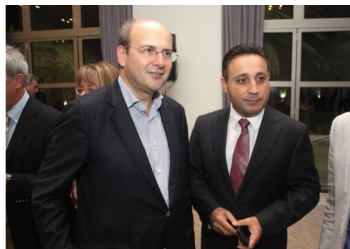
Με τον Αντιπρόεδρο της Ν.Α. κ. Κωστή Χατζιδάκη

Σημαντικό είναι να επισημάνουμε ότι εντός του 2016 εκτός από τις πολλαπλές συναντήσεις που είχε το Δίκτυο με όλες τις ηγεσίες του Υπουργείου Εσωτερικών (Κουρουπλής, Βερναρδάκης, Σκουρλέτης, Πουλλάκης), είχε επίσης και ενημερωτικές συναντήσεις με τα περισσότερα κόμματα του Ελληνικού κοινοβουλίου συγκεκριμένα εκτός από το κόμμα των Σύριζα όπου οι συναντήσεις έγιναν με εν ενεργεία Υπουργούς, από την Νέα Δημοκρατία έγινε ενημερωτική συνάντηση με τον υπεύθυνο Εσωτερικών του κόμματος τον κ. Βορίδη καθώς και με τον Γραμματέα