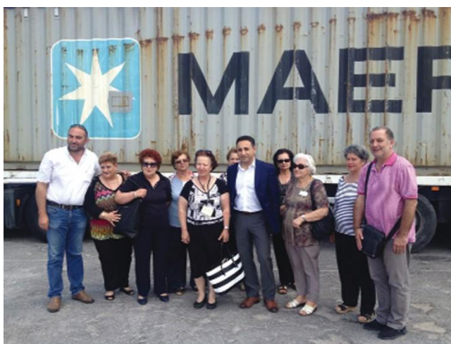
Με τον φιλανθρωπικό σύλλογο Αγ. Μαρίνα στη παράδοση υγειονομικού υλικού.

Αναφορά επίσης θα πρέπει να γίνει στις πρωτοβουλίες του Συμπαραστάτη προκειμένου να διευκολυνθούν δωρεές συλλόγων προς ιδρύματα με κυριότερη την συνεργασία με τον φιλανθρωπικό σύλλογο Παραδεισίου Ρόδου Αγία Μαρίνα με τον οποίο έγιναν δωρεές δεκάδων τόνων υγειονομικού υλικού προς τα ιδρύματα και τα Νοσοκομεία της Περιφέρειας μας.