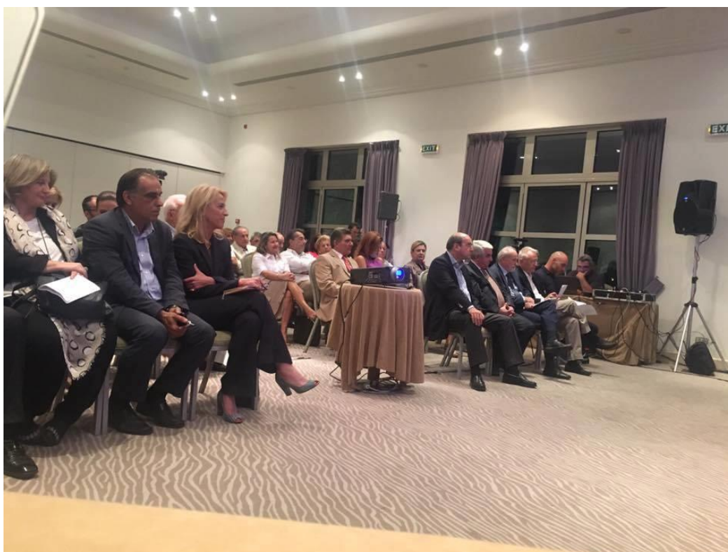
3η Πανελλήνια Συνδιάσκεψη του Δικτύου Συμπαραστατών

Στις 1 και 2 Οκτωβρίου 2016 έγινε υπό την αιγίδα του Προέδρου της Δημοκρατίας κ. Προκόπη Παυλόπουλου στην Αττική με διοργανωτή τον Δήμο Σαρωνικού το τρίτο Πανελλήνιο συνέδριο του Δικτύου Συμπαραστατών και το παρών έδωσαν το σύνολο των κομμάτων του Ελληνικού κοινοβουλίου καθώς και φορείς της Τοπικής Αυτοδιοίκησης.